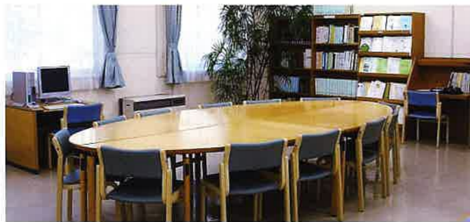
▲音声パソコンなどを備えた閲覧室

全国の視覚障がい者情報提供施設・団体とネットワークを結び、図書や雑誌を貸出します。貸出し及び返却は郵送のため、来館の必要はなく送料も無料です。