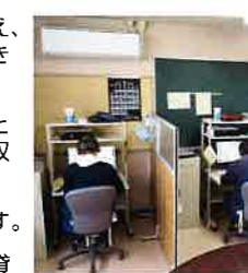
▲デージー編集作業