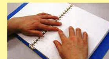
▲点字は触覚でわかる視覚障がい者用の文字です