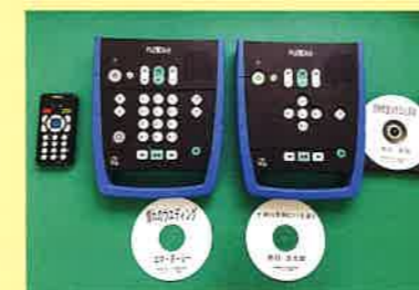
◀デージー図書再生機

※デージー Digital Accessible Information System (アクセシブルな情報システム)