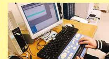
▲パソコンと専用機械をつなぎ、紙に打ち出さずに、点字を読むことができます