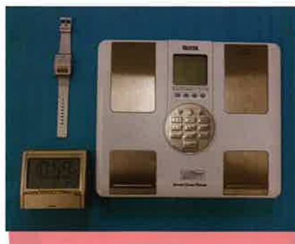
▲ 音声時計 音声体重計