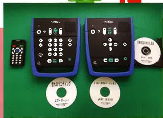
▲ 録音図書(デージー図書)と再生機(プレクストーク)