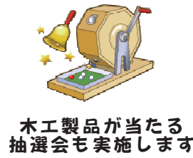
木工製品が当たる 抽選会も実施します