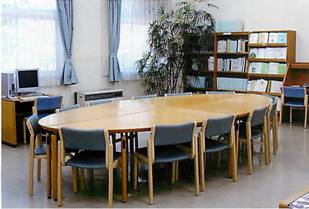
▲音声パソコンなどを備えた閲覧室

全国の視覚障害者情報提供施設・団体とネットワークを結び、図書や雑誌を貸出します。貸出しは郵送のため、来館の必要がなく送料も無料です。