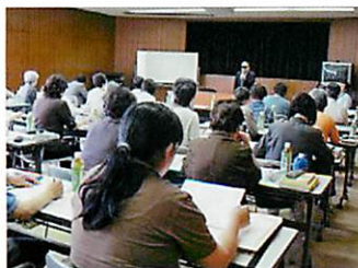
▲ボランティア研修会