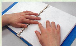
▲点字は触覚でわかる 視覚障がい者用の文字です