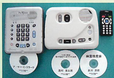
◀デイジー図書 再生機