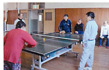
▲サウンドテーブルテニス

ホームページ http://homepage3.nifty.com/f-shien/