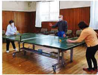
▲サウンドテーブルテニス