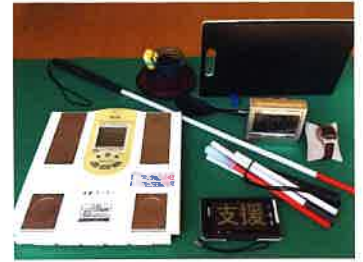
▲主な生活用具 左から音声体重計 拡大読書器 白杖 音声時計 後方に調理器具

相談等 電話 (024)535-5275 FAX(024)563-1543 メールアドレス f-shien@nifty.com