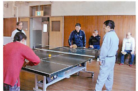
▲サウンドテーブルテニス（盲人卓球）を練習している皆さん。

ホームページ http://homepage3.nifty.com/f-shien/