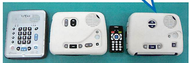
▲デジジー再生専用機各種(当館で貸出しをしているのは、一番右のプレクストークPTN1です)

デジジー図書(CD)は、カセットテープでは不可能だった、聞きたい箇所をページや見出しで検索できる快適な音声図書ですが、再生には専用機を使います。点字図書館では、再生機の貸出しも行っています。