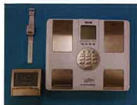
音声時計・音声体重計