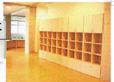
ご利用者専用ロッカー