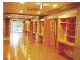
ユニット型リビング