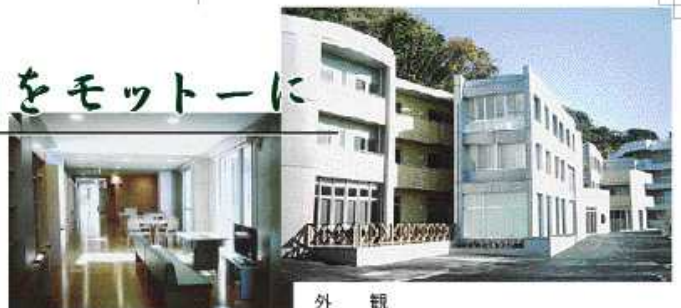
ユニットスペース