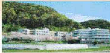
鋸南苑では、21世紀の選ばれる開放型施設を目指しています。

「自由」・「家庭的」・「笑顔」を運営方針とし、「ご利用者第一」と「心」のサービスを提供する。また、ご利用者が「鋸南苑に来てよかった」と言えるために、職員全員で個人の尊厳を大切に、1日を安全で安心に送って頂けるようにする。