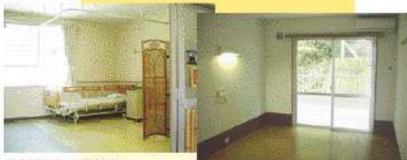
従来型居室（2床部屋）