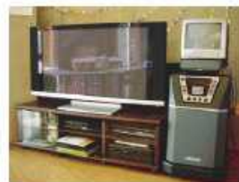
50インチの大型TVにて映画鑑賞会も行っております

鋸南苑デイサービスセンターでは、ご利用者が1日を安全に安心して過ごせるよう配慮しております。デイサービスでは、ご家庭で生活される延長上と考えており、普段の「自分らしさ」を重視した1日を送って頂けるよう配慮しております。「ここに来てよかった」と言っていただけるよう、職員全員で、誠心誠意のある対応をいたします。 鋸南苑 施設長