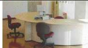
ナースステーション