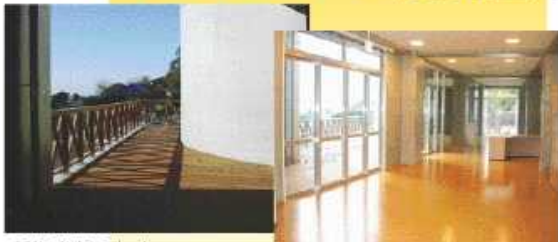
ご利用者専用デッキ