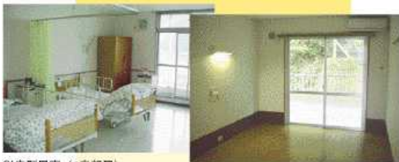
従来型居室（4床部屋）