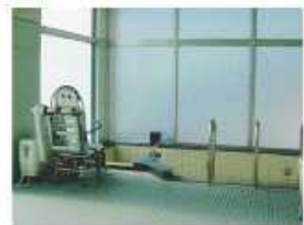
デイサービス一般浴槽