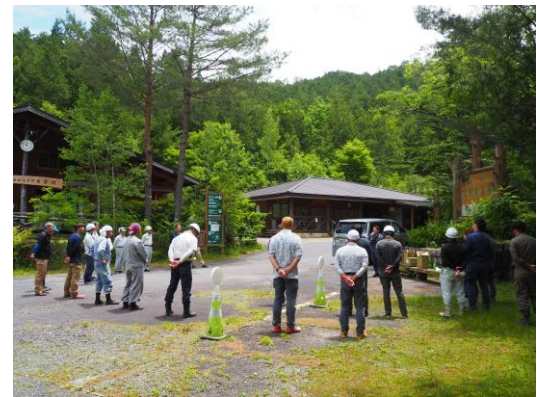
木曾支部長から作業終了あいさつ