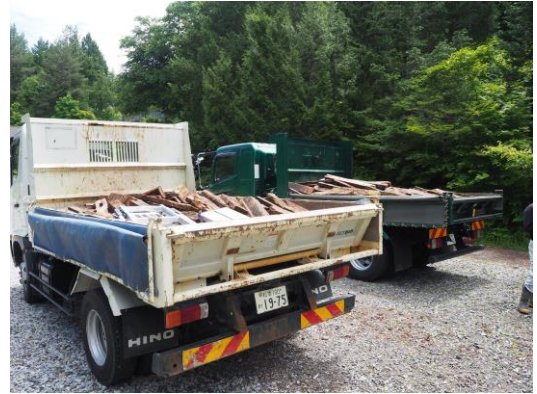
トラックに積込完了