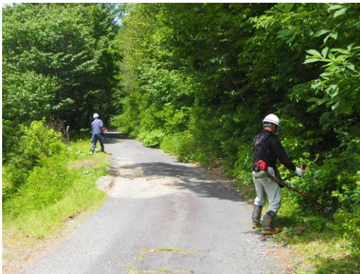
治山運搬路の草刈