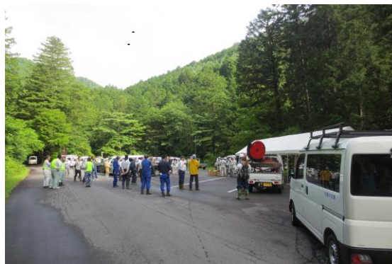
作業前のミーティング