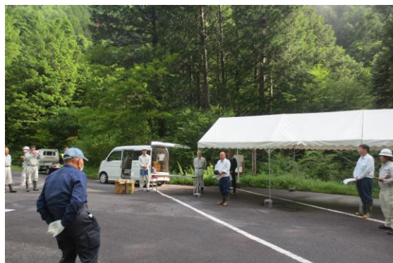
南木曾支署長あいさつ