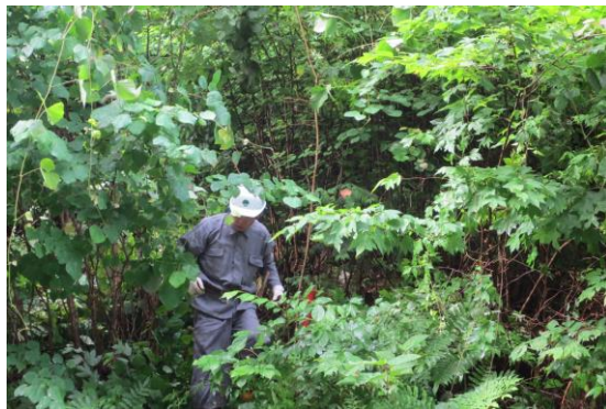
林道沿線の修景作業