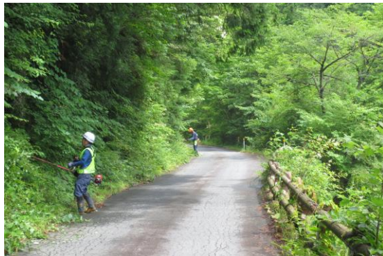
林道沿線の草刈り作業