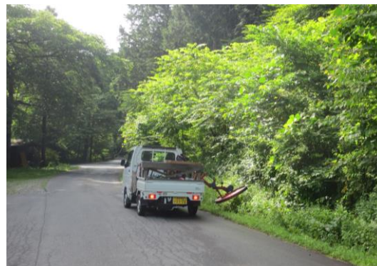
軽トラの草刈機械