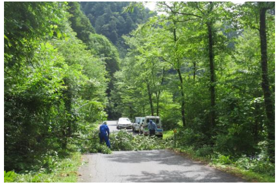
林道沿線の危険木除去