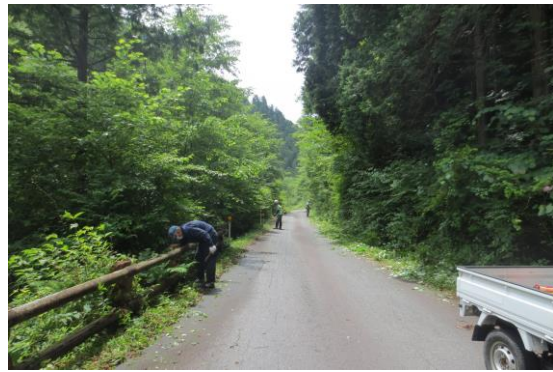
林道沿線の草刈り作業