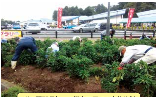
道の駅那須与一の郷大田原での奉仕作業