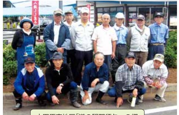
大田原東地区「道の駅那須与一の郷」