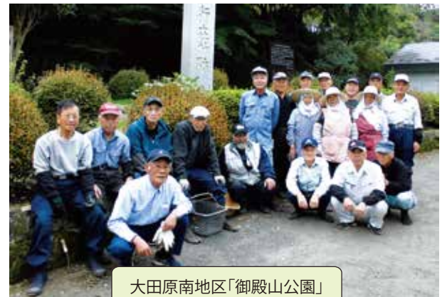
大田原南地区「御殿山公園」