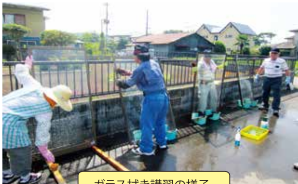
ガラス拭き講習の様子