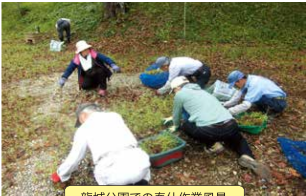
龍城公園での奉仕作業風景