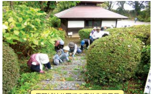
黒羽城址公園での奉仕作業風景