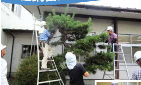
植木剪定従事者講習の様子