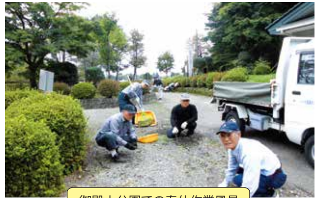
御殿山公園での奉仕作業風景