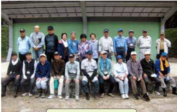
大田原北地区「龍城公園」