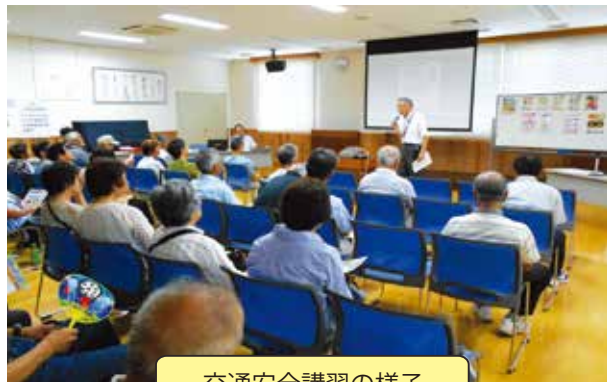
交通安全講習の様子

シルバー人材センターでは、7月を安全就業強化月間の一環として安全技能講習会を開催しています。7月12日(木)植木剪定従事者講習会には、14名の参加者がありました。7月13日(金)刈払機従事者講習会には、21名の参加者がありました。7月18日(水)ガラス拭き講習では、4名の参加者がありました。7月27日(金)交通安全講習には、33名の参加者があり、期間中延べ72名の参加者がありました。参加された方々は、技術の向上及び安全就業のため、真剣に講習会を受講されていました。