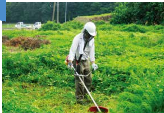
刈払機従事者講習の様子