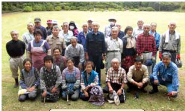
黒羽地区「黒羽城址公園」